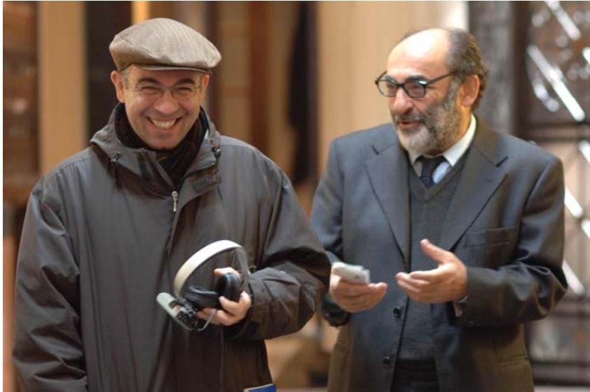
Giuseppe Tornatore (links)

Giuseppe Tornatore werd op 27 mei 1956 geboren op Sicilië, Italië. Op zestienjarige leeftijd begon hij met acteren in een toneelgezelschap waarmee hij op het podium stond met verschillende stukken. Zijn eerste stap in de filmwereld zette hij toen hij een documentaire maakte over Siciliaanse minderheden: Le Minoranze Etniche in Sicilia . Hiermee won hij een prijs op het Filmfestival van Salerno. Ook werkte hij aan verschillende televisieproducties voor het Italiaanse RAI. Zijn eerste echte regiedebuut maakte hij echter in 1986 met de film Il Camorrista . Giuseppe Tornatore heeft als regisseur al vele prijzen gewonnen. Zo ontving de film L'Uomo Delle Stelle de grote juryprijs op het filmfestival van Venetië. Daarnaast was Tornatore 3 keer genomineerd voor een Gouden Palm op het filmfestival van Cannes en kreeg hij daar de grote juryprijs voor de film Nuovo Cinema Paradiso waarvoor hij ook de BAFTA voor de beste buitenlandse film ontving. Nuovo Cinema Paradiso is een emotioneel eerbetoon aan de wereld die film ooit was. Voor deze film won Tornatore onder andere een Academy Award (Oscar) for Best Foreign Language, een Golden Globe en maar liefst vijf BAFTA's. Zijn laatste film Malina werd ook genomineerd voor de BAFTA voor de beste buitenlandse film en voor de Gouden Leeuw op het Filmfestival van Berlijn. In 1993 maakte Tornatore deel uit van de jury van het filmfestival van Venetië.