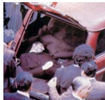
Van links naar rechts: Paolo Graziosi (More in IL DIVO), Aldo Moro, de ontdekking van Moro's lijk na ontvoering in 1978.