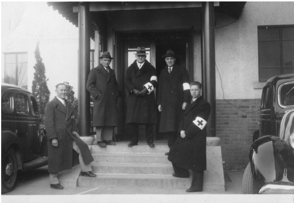
Bij het hoofdkantoor van de Nanking “safety zone”, in het midden John Rabe.

Het Japanse leger trok naar Nanking, waarbij ieder dorp dat op de weg naar Nanking lag volgens het zogenaamde drie-in-een beleid (plunder, verkracht/vermoord en verbrand alles) van het keizerlijke Japanse leger verwoest werd. Op 13 december 1937 viel de hoofdstad Nanking. De dolgeslagen Japanse soldaten verkrachtten vrouwen van alle leeftijden, vermoorden Chinese burgers en krijgsgevangenen en alles werd geplunderd en afgebrand. Het bloedbad van Nanking duurde weken en heeft naar schatting aan 340.000 mensen het leven gekost. Deze zwarte bladzijde in de geschiedenis van China staat bekend als de verkrachting van Nanking en zorgt tot op de dag van vandaag nog voor beroering tussen Chinezen en Japanners.