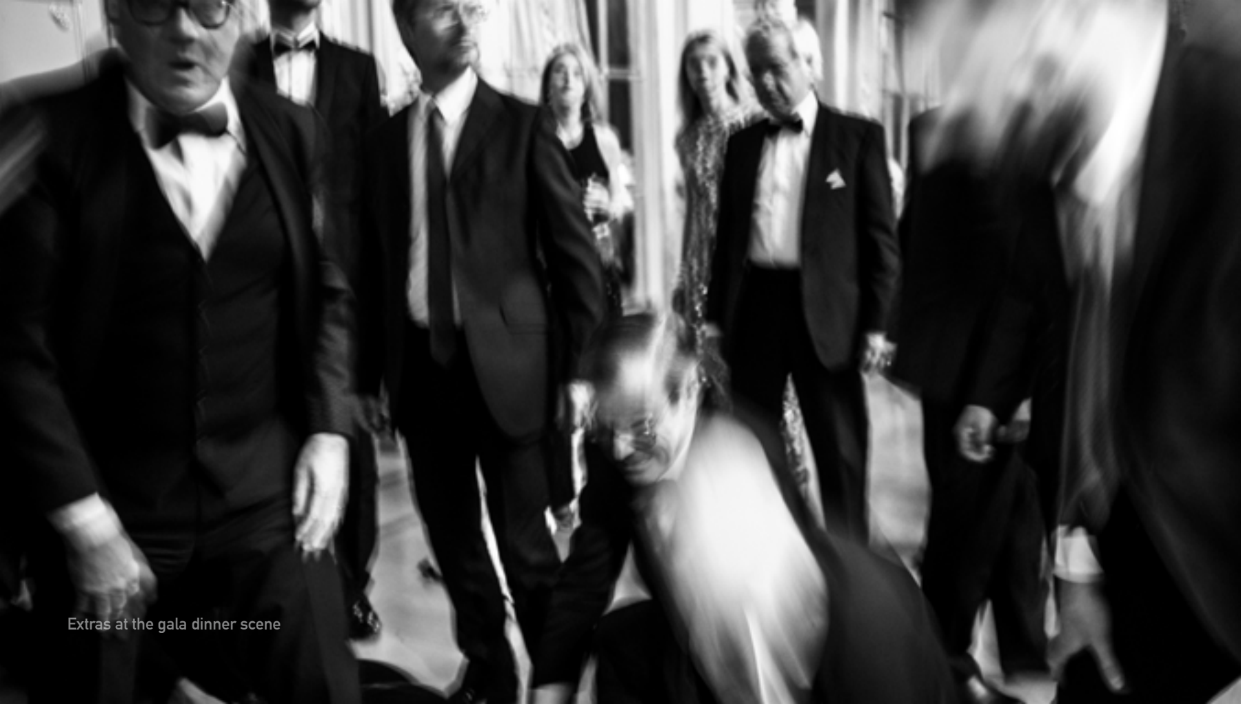
Extras at the gala dinner scene

Director's Note Note d'intention du réalisateur