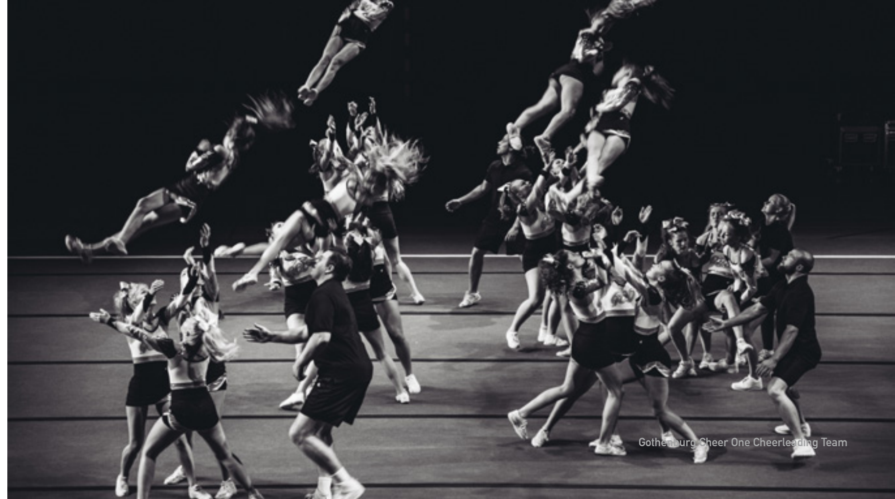
Gothenburg Cheer One Cheerleading Team

Dans THE SQUARE, un jeu d'acteur réaliste et intimiste s'impose. La relation affectueuse entre Christian et ses filles pom-pom girls constitue le cœur émotionnel du film et dénote, par des images concrètes, l'idée d'une quête d'utopie. En effet, les fillettes s'épaulent les unes les autres et font preuve d'un véritable esprit d'équipe, où chacune d'entre elles contribue équitablement à la réussite du groupe. Voir une petite fille de dix ans effectuer un saut périlleux, en comptant sur ses camarades pour la rattraper, est également une manifestation visuelle du rôle de la confiance en l'autre. La concentration et la bonne humeur des pom-pom girls illustrent la meilleure facette de la société américaine, un « esprit d'équipe » résultant de la méfiance des Américains envers l'État, qui sait ?