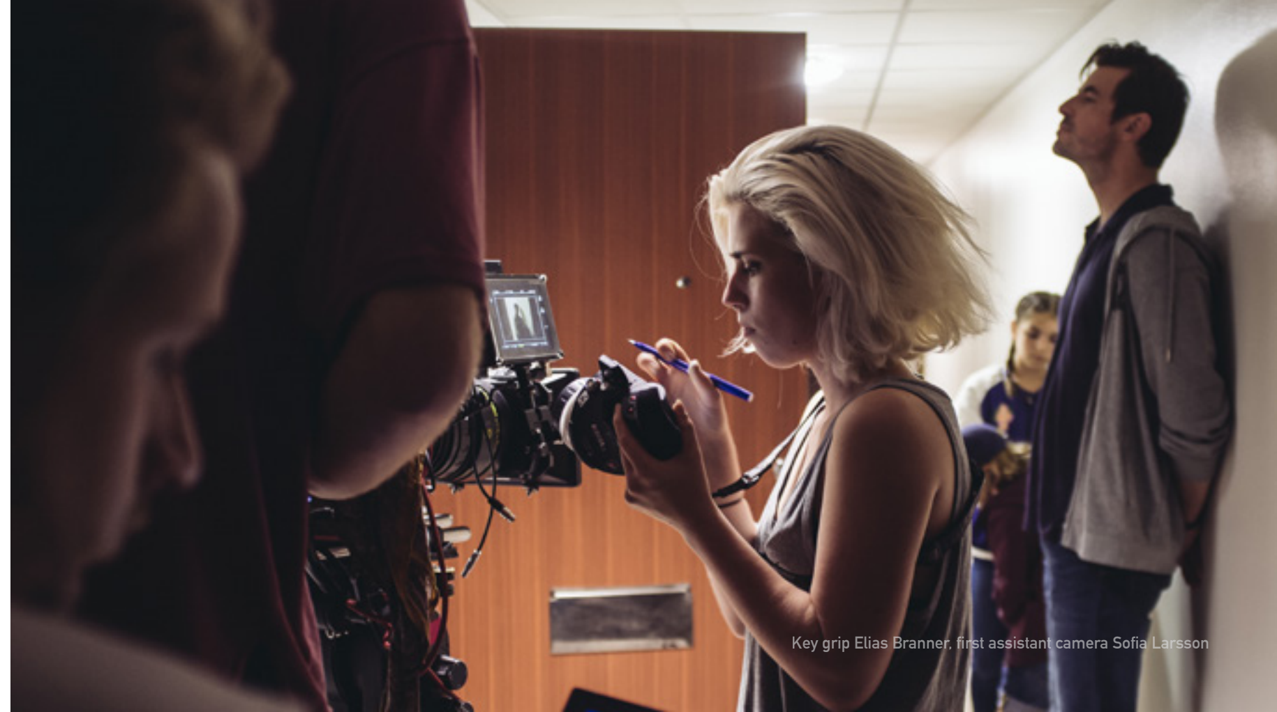
Key grip Elias Branner, first assistant camera Sofia Larsson

Christian se pose des questions auxquelles nous sommes tous confrontés : la prise de responsabilités, la confiance en l'autre, la fiabilité, ainsi que la conduite morale sur le plan individuel. Et lorsqu'il se trouve face à un dilemme, ses actes sont en contradiction avec les valeurs morales qu'il défend. Christian incarne un véritable paradoxe, comme la plupart d'entre nous.