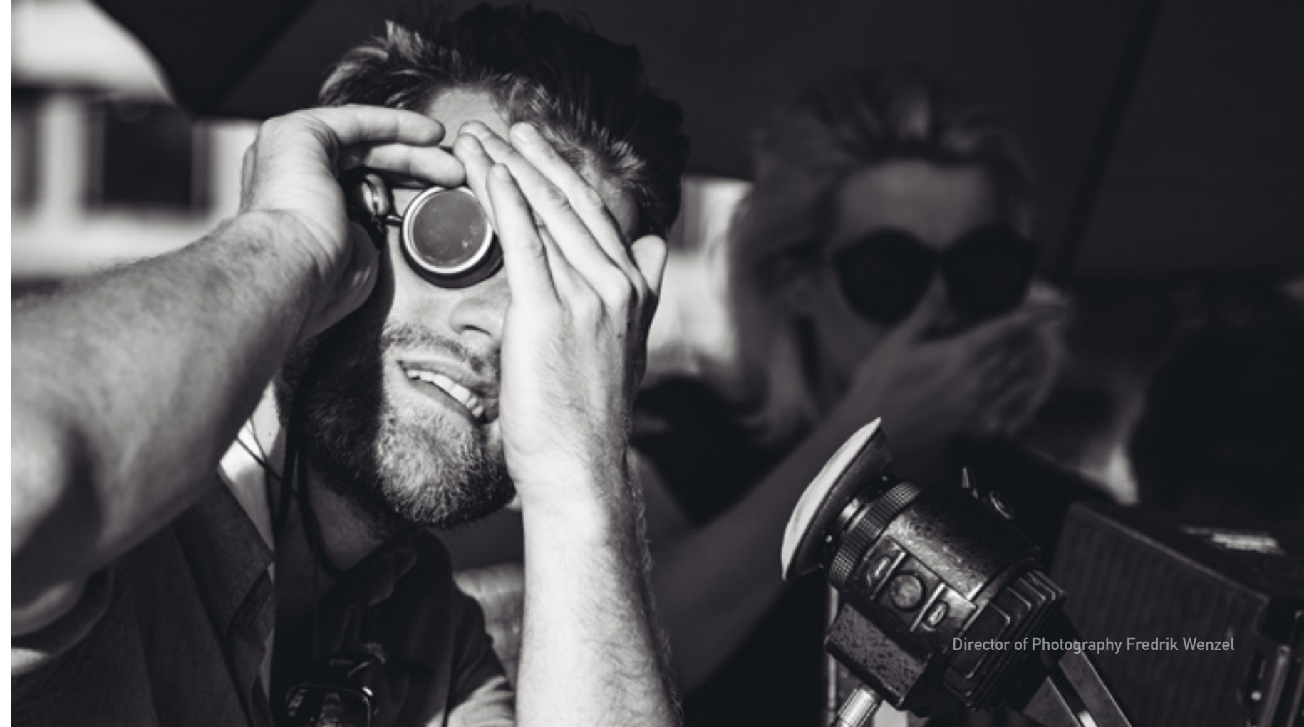
Director of Photography Fredrik Wenzel

Je trouve essentiel d'en analyser les effets, car je suis convaincu que l'image vidéo est le moyen d'expression le plus efficace que nous ayons jamais eu, et par conséquent le plus dangereux.