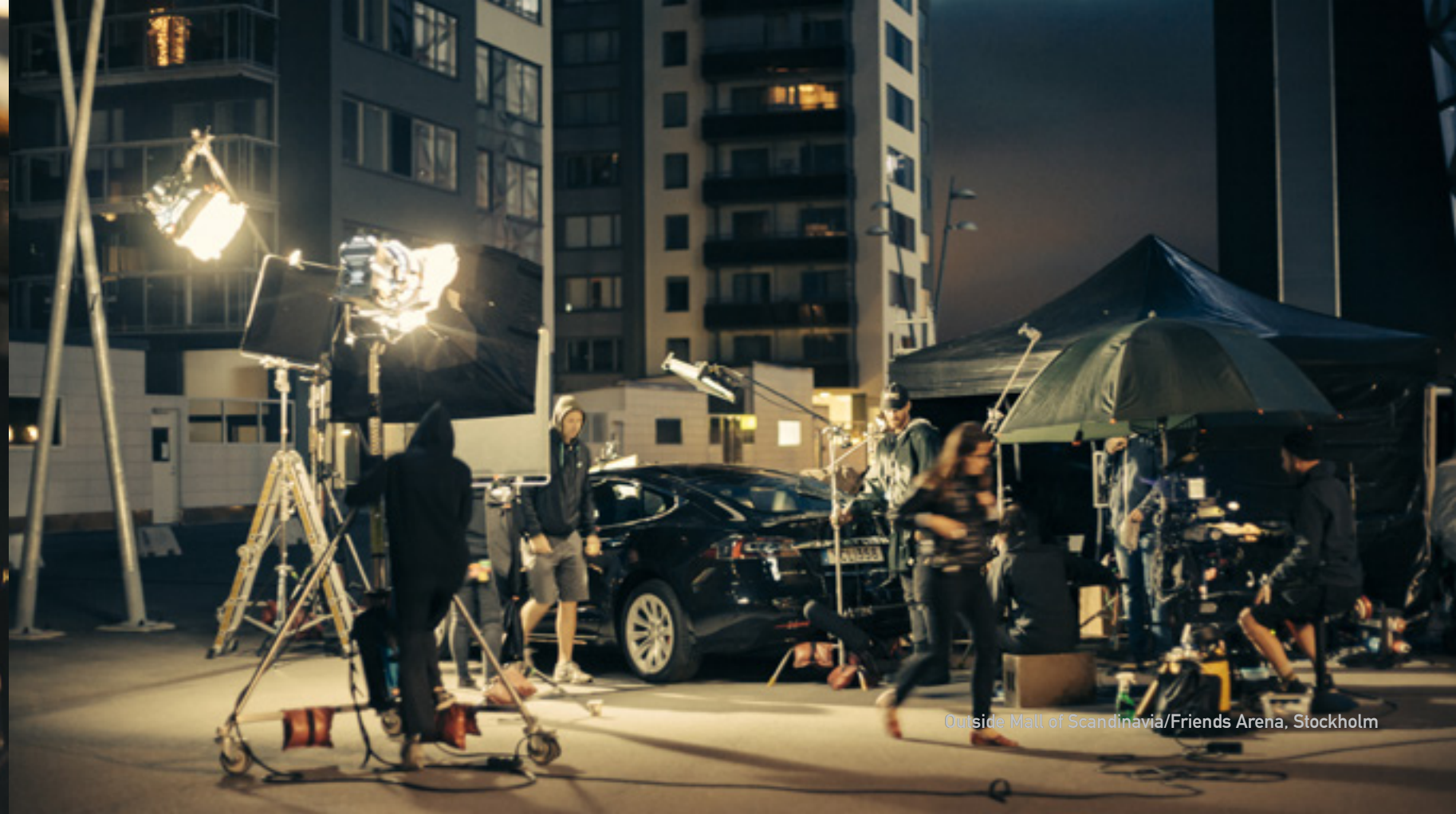
Outside Mall of Scandinavia/Friends Arena, Stockholm