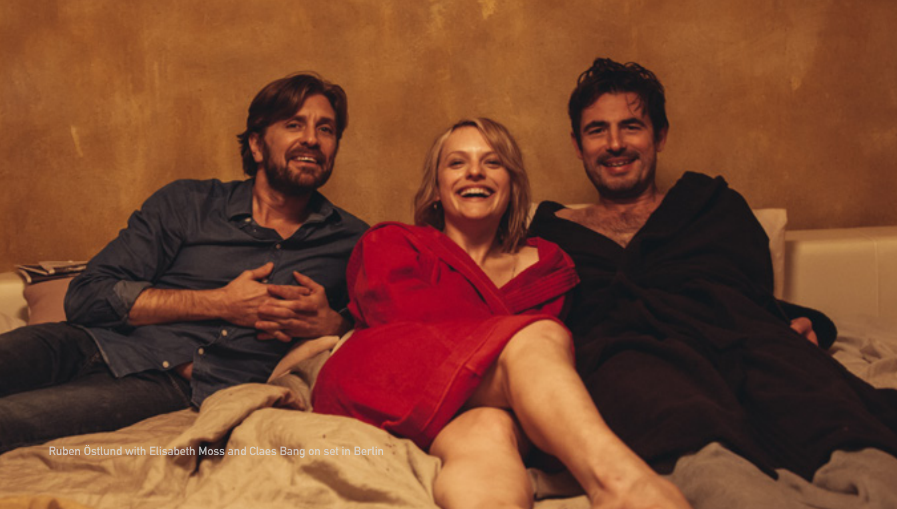
Ruben Östlund with Elisabeth Moss and Claes Bang on set in Berlin