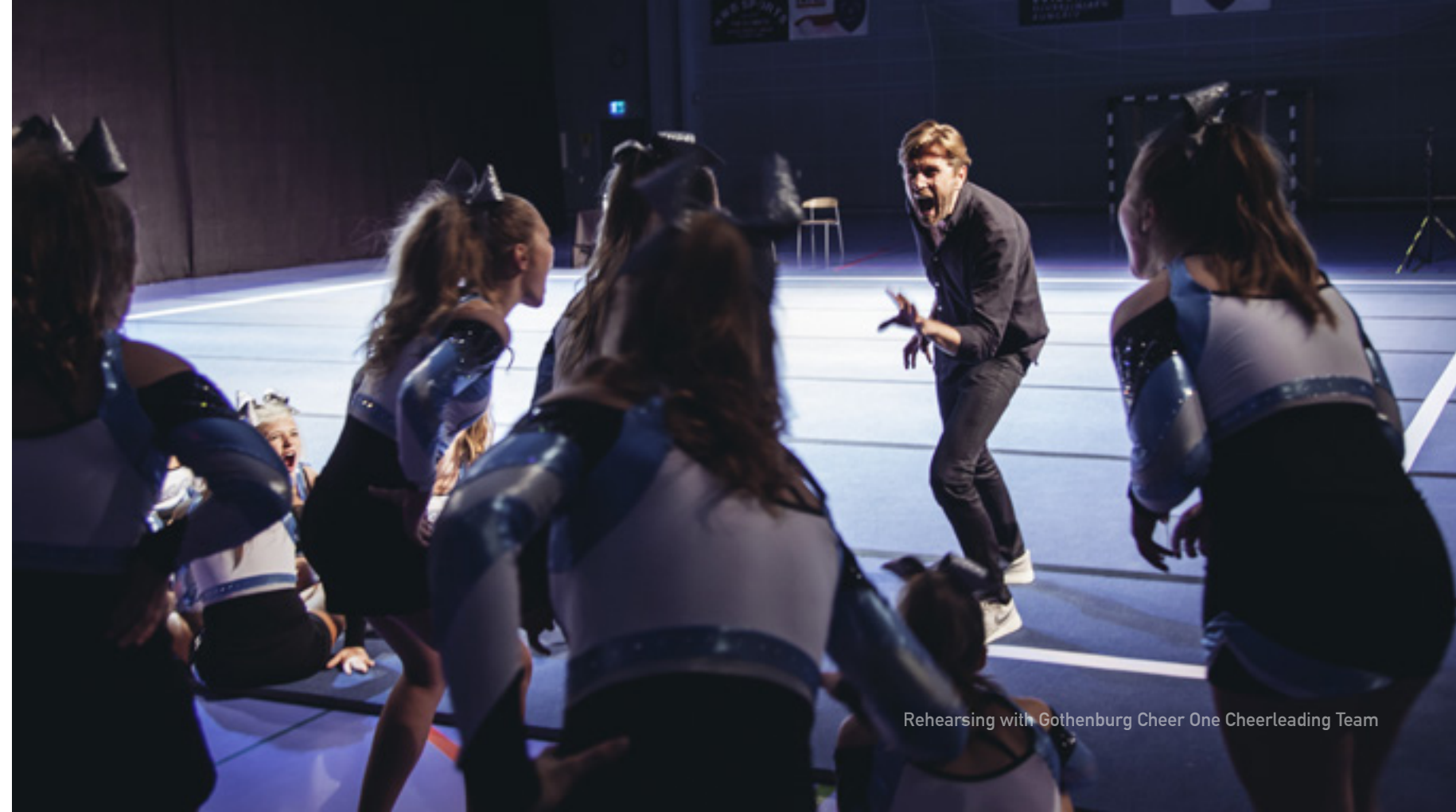
Rehearsing with Gothenburg Cheer One Cheerleading Team

Ce qui est nouveau, c'est seulement la manière que nous avons choisie d'évoquer ces valeurs. Le carré est un espace aux valeurs altruistes, fondé selon l'éthique de réciprocité commune à presque toutes les religions (la « règle d'or » : ne fais pas aux autres ce que tu ne voudrais pas que l'on te fasse)