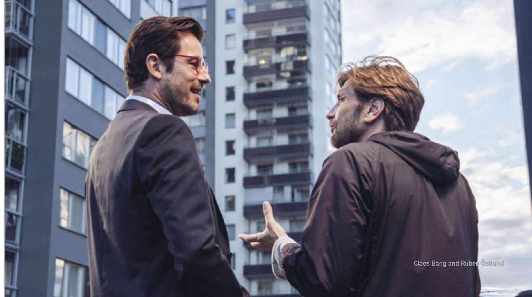
Claes Bang and Ruben Östlund

2008 a marqué l'apparition du premier « quartier fermé » en Suède, un lotissement sécurisé auquel seuls les propriétaires en ayant l'autorisation peuvent accéder. Il s'agit là d'un exemple extrême qui montre que les classes privilégiées s'isolent du monde qui les entoure. C'est également un des nombreux signes de l'individualisme grandissant dans nos sociétés européennes, alors que la dette du gouvernement s'alourdit, que les prestations sociales diminuent et que le clivage entre riches et pauvres ne cesse de se creuser depuis une trentaine d'années. Même en Suède, pourtant reconnue comme l'un des pays les plus égalitaires au monde, le chômage croissant et la peur de voir son statut social décliner ont poussé les gens à se méfier les uns des autres et à se détourner de la société. Un sentiment général d'impuissance politique nous a fait perdre confiance en l'État