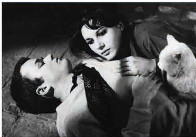
I pugni in tasca

Le 04.12 19:00/ BOZAR / Dans le cadre du Festival du film méditerranéen