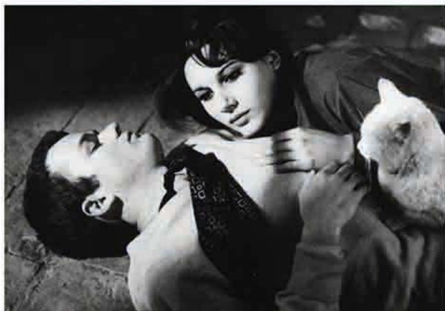
I pugni in tasca

Op 04.12 19:00/ BOZAR /In het kader van het Festival du film méditerranéen Brussel